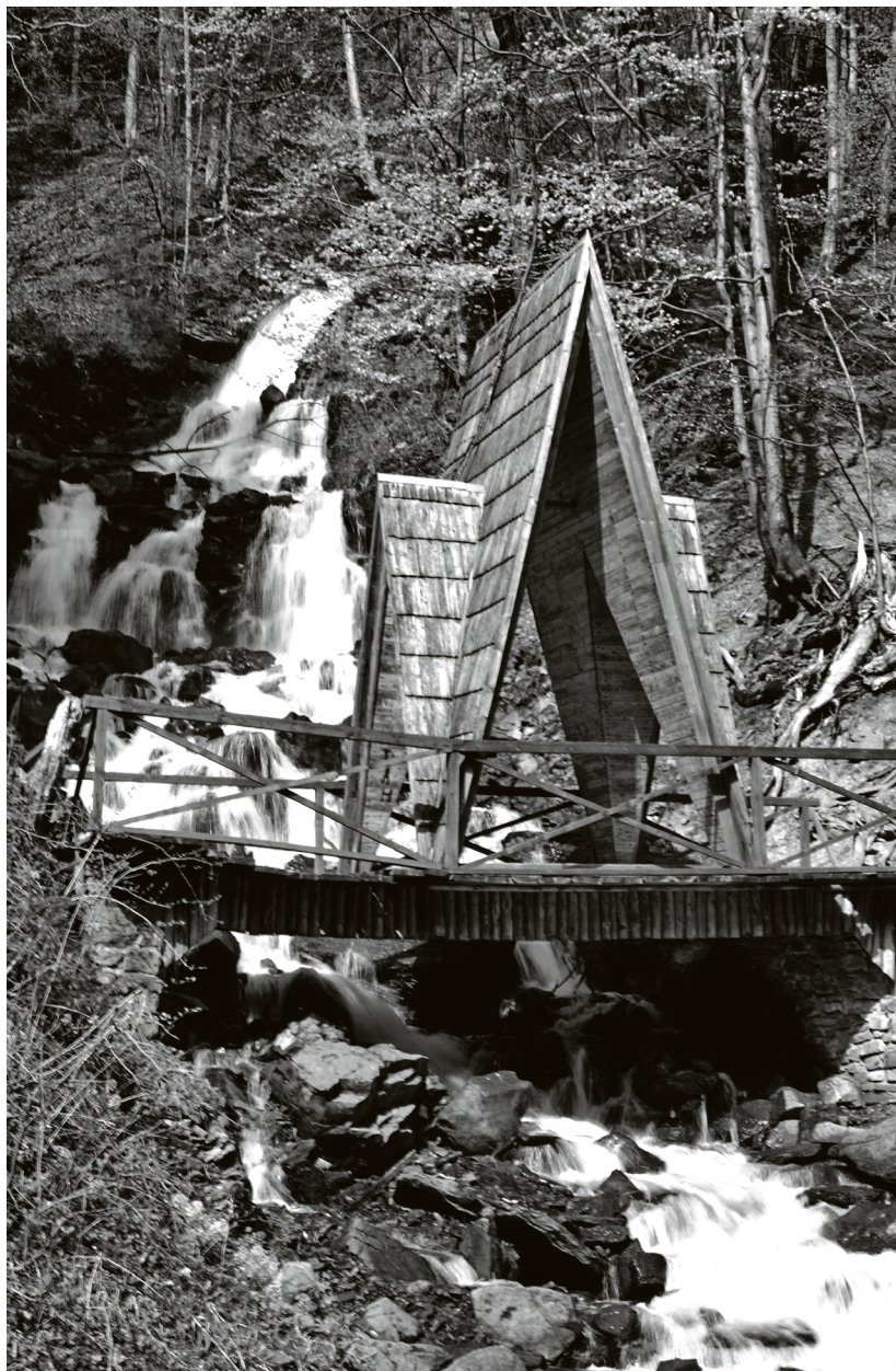
Водоспад Труфанець, Карпатський біосферний заповідник