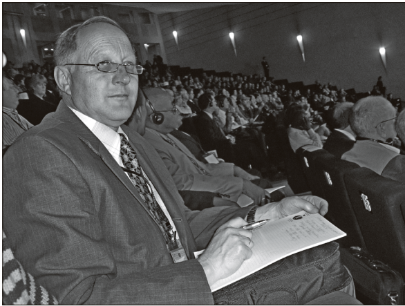
Директор Карпатського біосферного заповідника Ф.Д. Гамор на III Всесвітньому конгресі біосферних резерватів ЮНЕСКО (м. Мадрид, 2008 р.)