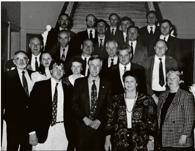
Українські екологи на зустрічі, під час навчання в США у рамках програми з міжнародного розвитку США (IUSD), з губернатором американського штату Мейн Августом Кінгом та конгресменом США Джоном Балдачі (відповідно третій і четвертий у першому ряду). У другому ряду перший справа – директор Карпатського біосферного заповідника Ф.Д. Гамор, другий – начальник Головного управління національних природних парків і заповідної справи Мінприроди України М.П. Стеценко. Другий зліва, в останньому ряду – директор Дунайського біосферного заповідника О.М. Волошкевич (Штат Мейн, США, травень 1995 року).