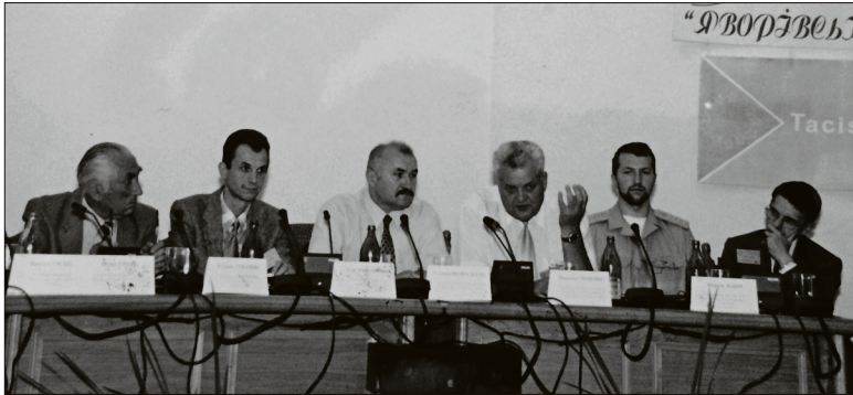
Засідає науково-технічна рада Яворівського національного природного парку. Перший зліва – патріарх заповідної справи в Україні, доктор біологічних наук, професор, лауреат державної премії України у галузі науки і техніки С.М. Стойко (сміт Івано-Франково, 2001 рік).