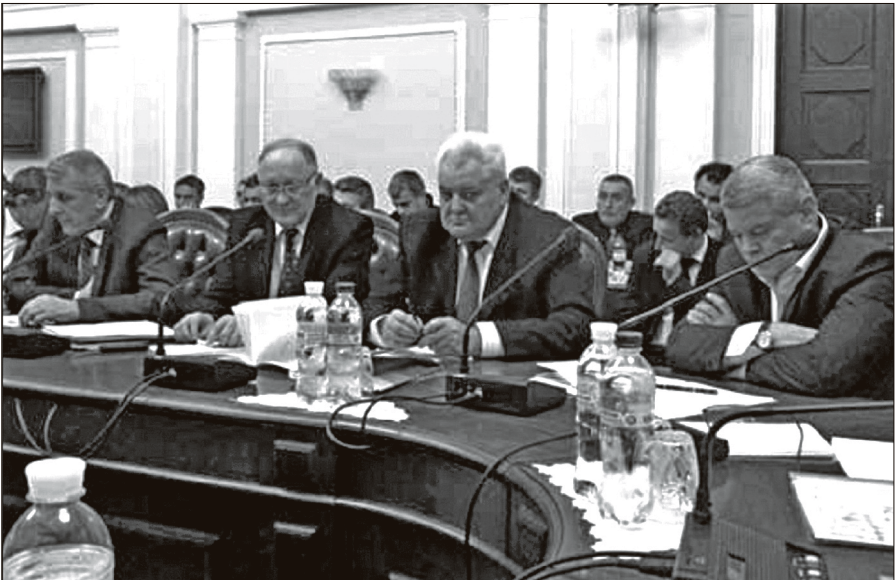
На комітетських слуханнях у Верховній Раді України обговорюються проблеми збереження природно-заповідного фонду (м. Київ, 4 лютого 2015 р.).