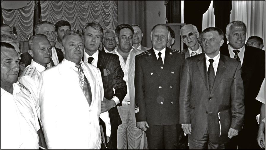
Фото на згадку учасників Всеукраїнської наради із розвитку заповідної справи в Україні з Президентом України В.А. Ющенком (с. Гаївка Шацького району Волинської області, 2009 р.).