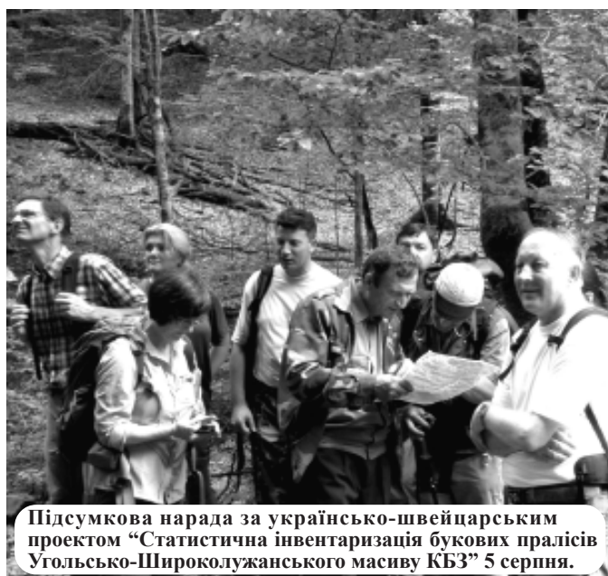
Підсумкова нарада за українсько-швейцарським проектом "Статистична інвентаризація букових пралісів Угольсько-Широколужанського масиву КБЗ" 5 серпня.