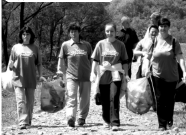
5 червня. Акція "Чиста країна" до Дня довкілля.