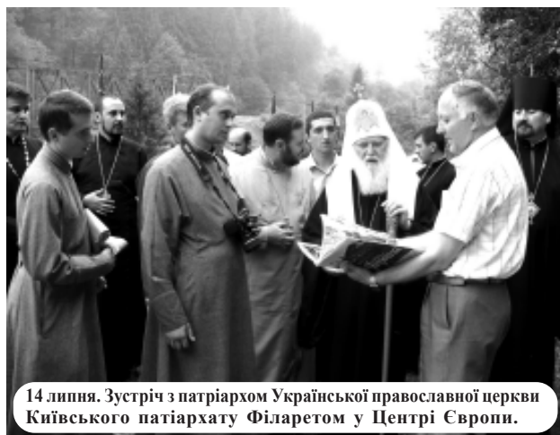
14 липня. Зустріч з патріархом Української православної церкви Київського патріархату Філаретом у Центрі Європи.