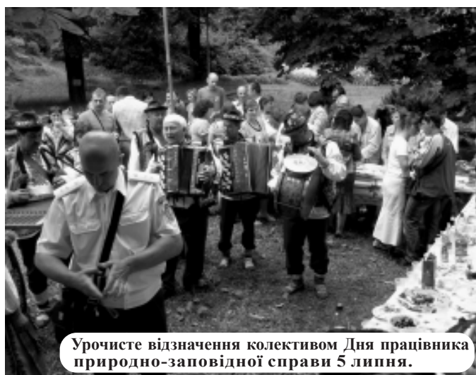
Урочисте відзначення колективом Дня працівника природно-заповідної справи 5 липня.