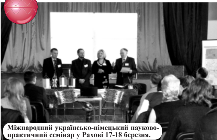
Міжнародний українсько-німецький науково-практичний семінар у Рахові 17-18 березня.