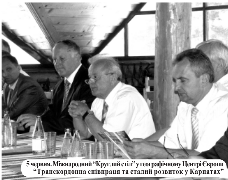
5 червня. Міжнародний "Круглий стіл" у географічному Центрі Європи "Транскордонна співпраця та сталий розвиток у Карпатах"