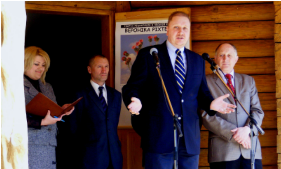
Виступає Генеральний консул Чеської Республіки у Львові Давід Павліта.