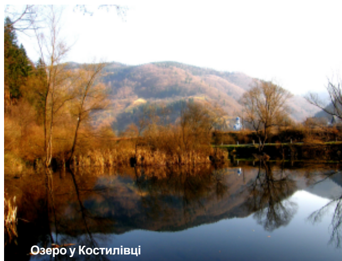
Озеро у Костилівці