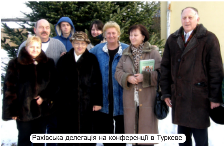
Рахівська делегація на конференції в Туркеве