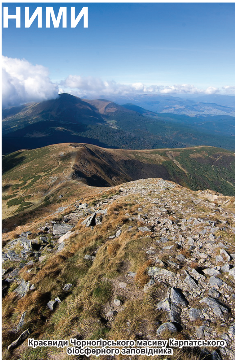
Краєвиди Черногірського масиву Карпатського біосферного заповідника

Ми скромно ставимося до своїх надбань, по-належному приймаємо заслужену критику, прагнемо виправляти недоліки. А працювати є над чим. На нарадах у заповіднику, про які йде мова, визначено пріоритетні завдання колективу на 2013-й рік. Це, зокрема, завершення робіт, пов'язаних із розширенням території КБЗ. Розпочнеться розробка проекту організації його території та охорони природних комплексів. А в Квасах буде розпочато спорудження міжнародного навчально-дослідного центру з вивчення букових пралісів Карпат та сталого розвитку. На базі КБЗ намічається провести ристоронню зустріч представників України,