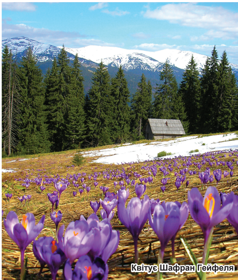
Квітує Шафран Гейфеля

Словаччини та Німеччини з підписання угоди щодо управління спільного об'єкта Всесвітньої спадщини ЮНЕСКО «Букові праліси Карпат та давні букові ліси Німеччини». Маємо також облаштувати візит-центри в Угольському та Черногірському ПНД-відділеннях.