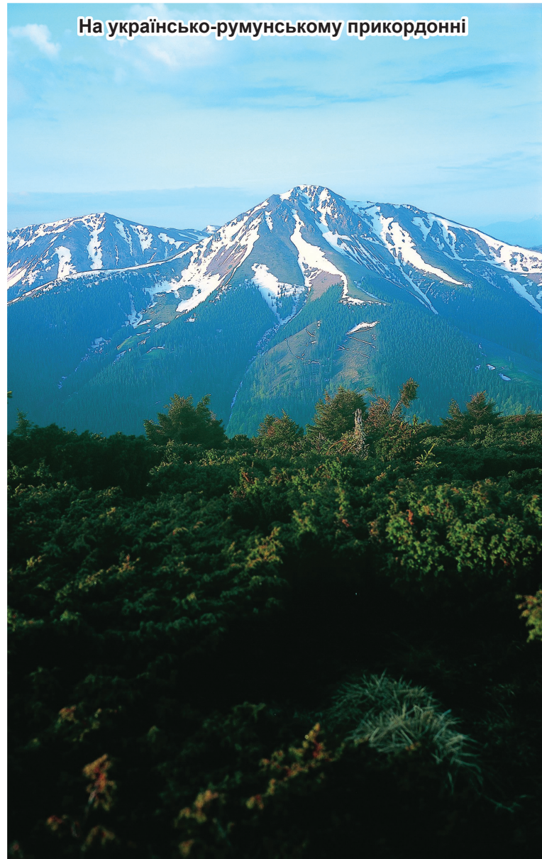
На українсько-румунському прикордонні