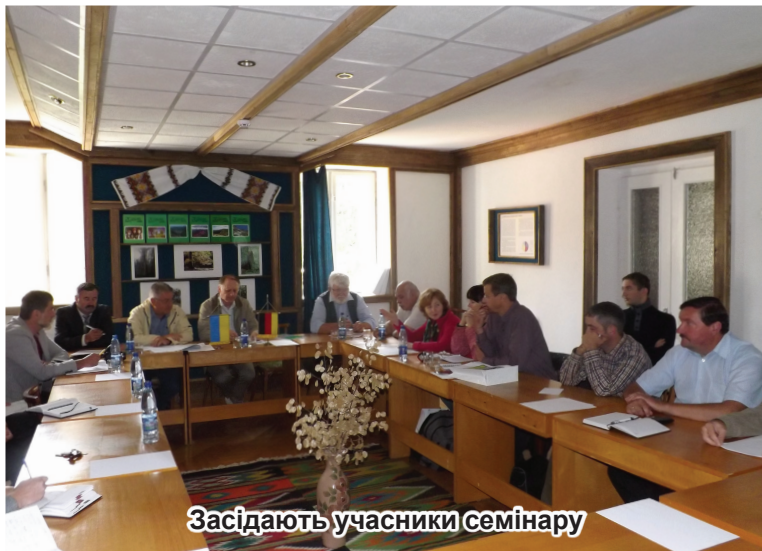
Засідають учасники семінару