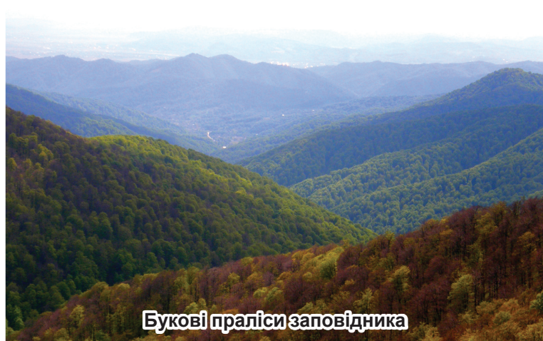
Букові праліси заповідника

Переконали, що наука в заповіднику набуде прикладного змісту і буде спрямована на отримання практичних результатів, дозволить розширити роботу зі створення демонстраційних об'єктів з питань збереження біорізноманіття Карпат, ведення лісового, водного, полонинського господарств, екотуристичної діяльності, збереження основ