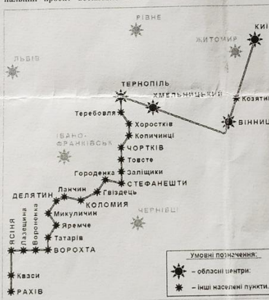
Маршрут, який, безсумнівно, стане рентабельним.

Рахів Закарпатської області (Матеріал опрацьовував і вкредитував Василь НІТКА), Ужгород