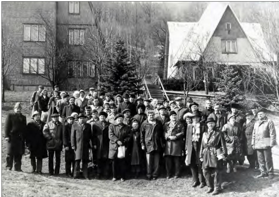
Під час науково-практичного семінару в Карпатському заповіднику відбувається перше обговорення Закону України «Про природно-заповідний фонд України» (1992 р.). На трибуні – заступник Міністра охорони навколишнього природного середовища України В.В. Костицький; фото учасників семінару на згадку