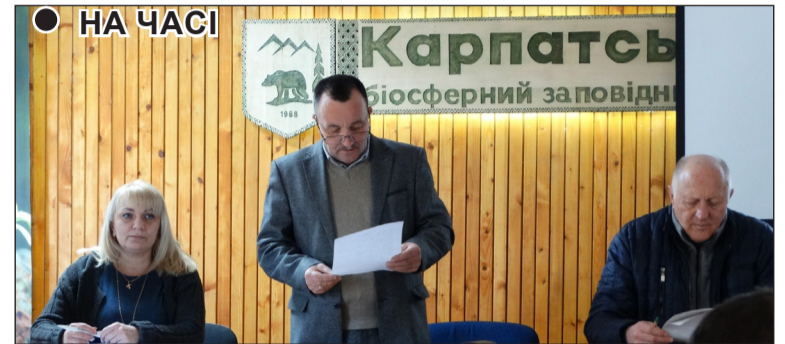
● НА ЧАСІ

нині розглядає клопотання Заповідника від 12.09.2023 №808 про надання дозволу на розроблення Проекту землеустрою щодо відведення земельних ділянок загальною площею 17913,6 га у постійне користування Карпатському біосферному заповіднику.