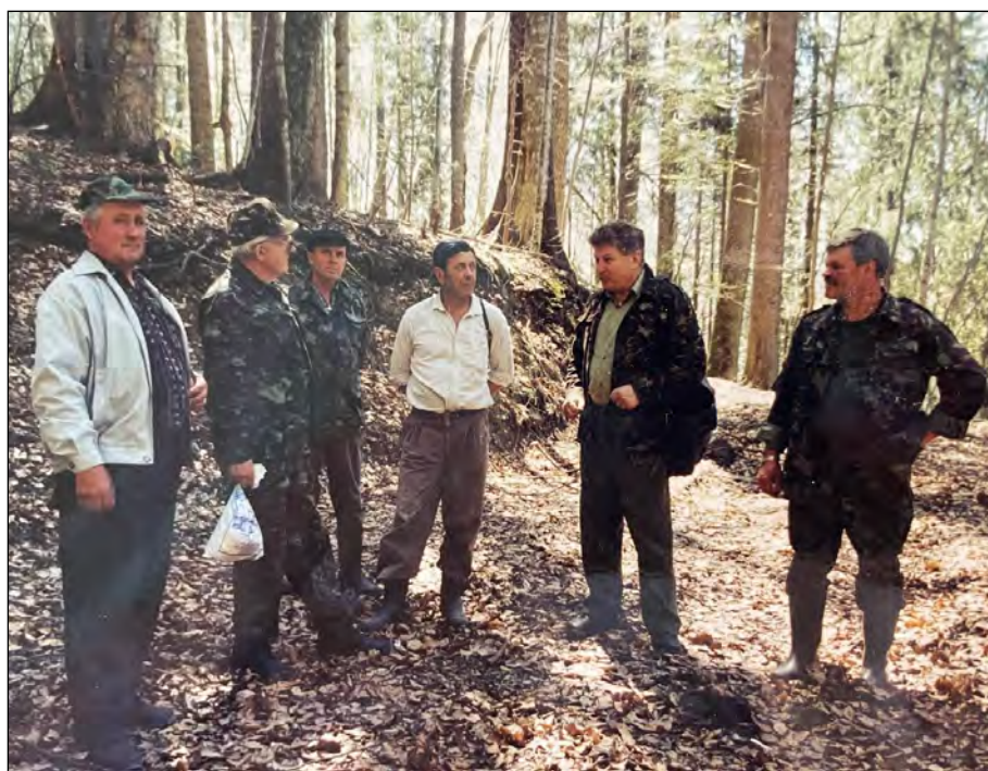
Обговорення плану робіт із закладання постійних пробних площ у Чорногірському ПНДВ, 2007 р.

Природа Карпат: науковий щорічник Карпатського біосферного заповідника та Інституту екології Карпат НАН України, 2022, № 1(7)