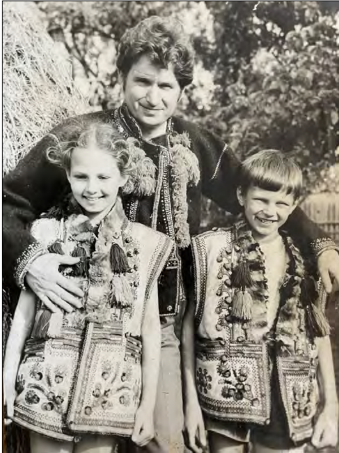
У рідному гуцульському вбранні, 1985 р.