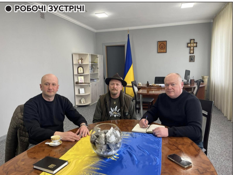
● РОБОЧІ ЗУСТРІЧІ